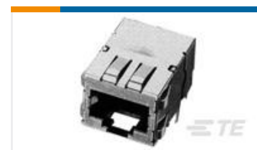
TE 产品编号5558070-1 MJ,R/A,10P,PNL GRN,DIR COMPT