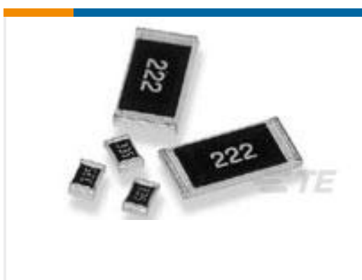
TE 产品编号3-2176067-2 CRG0201 1% 44R2