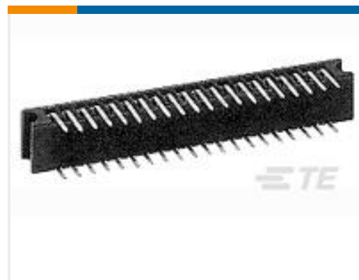
TE 产品编号7-532956-0 130 MODII 2PC CE RCPT ASSY, RoHS