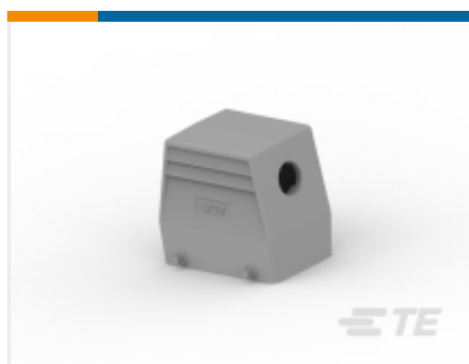
TE 产品编号T1319320120-000 H32A-TS-M20