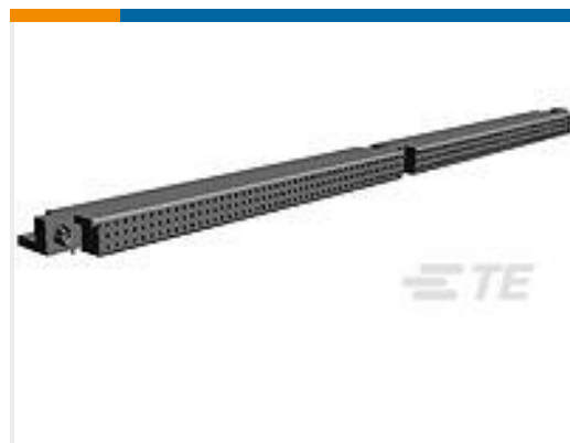
TE 产品编号5533514-6 ASSY,RECPT,R.ANGLE,HDI,LEAD-FR