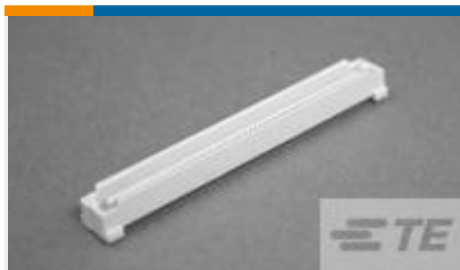
TE 产品编号5177984-6 0.8FH,P05H.5,140,08/Sn,TU