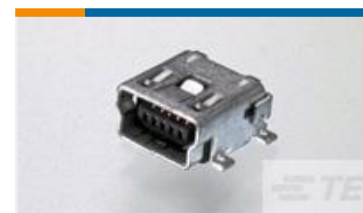
TE 产品编号1-1734035-2 MINI USB, TYPE B, R/A, SMT