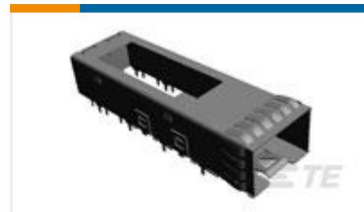
TE 产品编号2110304-1 SFP+ 1x1 Cage Assembly, Solder Tail