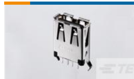
TE 产品编号1734366-3 Std USB Type A, VT, T/H, Blue