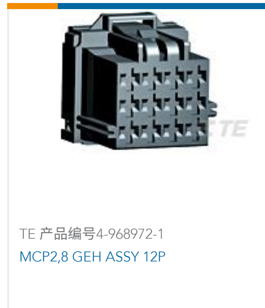
TE 产品编号4-968972-1 MCP2,8 GEH ASSY 12P