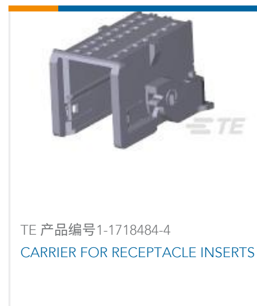
TE 产品编号1-1718484-4 CARRIER FOR RECEPTACLE INSERTS