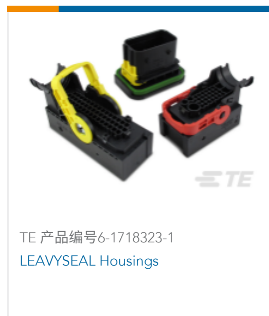
TE 产品编号6-1718323-1 LEAVYSEAL Housings