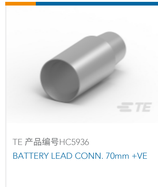
TE 产品编号HC5936 BATTERY LEAD CONN. 70mm +VE