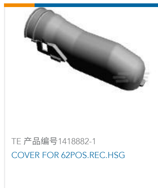
TE 产品编号1418882-1 COVER FOR 62POS.REC.HSG