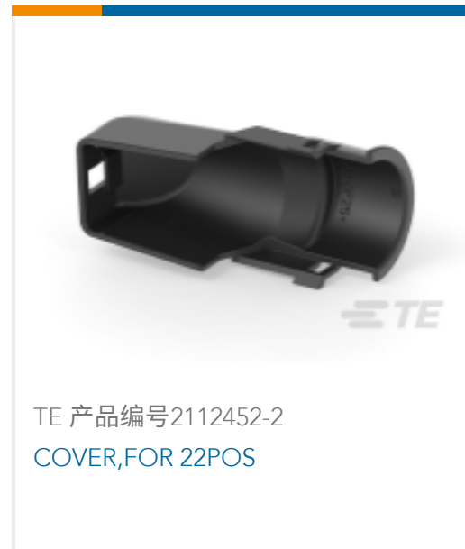
TE 产品编号2112452-2 COVER, FOR 22POS