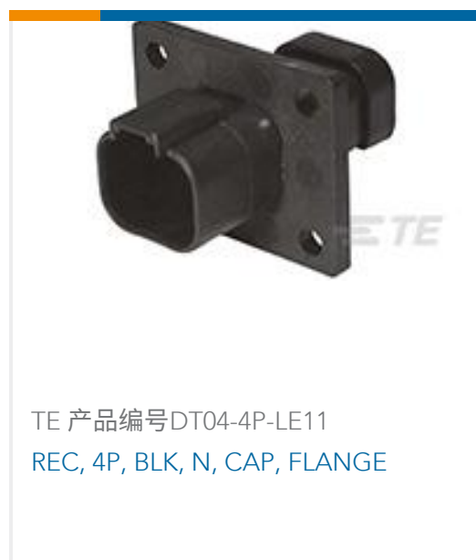
TE 产品编号DT04-4P-LE11 REC, 4P, BLK, N, CAP, FLANGE