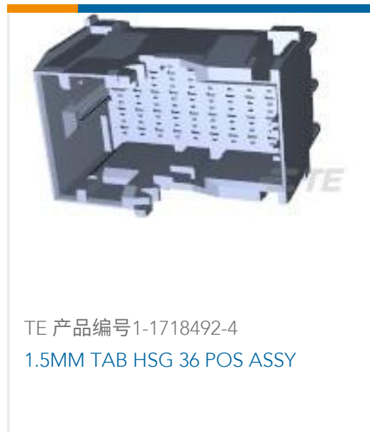
TE 产品编号1-1718492-4 1.5MM TAB HSG 36 POS ASSY