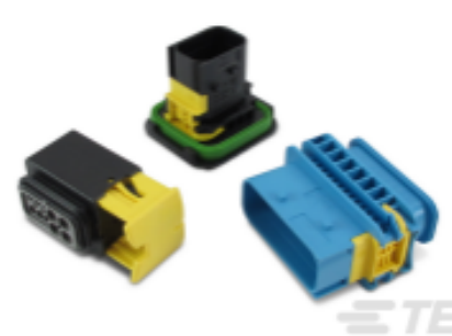
TE 产品编号 CAT-H3399-CH8172 重载密封系列连接器塑壳