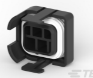
TE 产品编号 2112291-1 PROTECTION CAP, GROUP B, ASSY