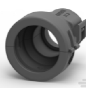
TE 产品编号 965786-1 ABDECKKAPPE 180GRD