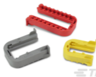
TE 产品编号 CAT-H3399-SL34 重载密封系列连接器固定夹