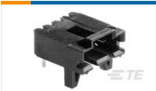
TE 产品编号5-103672-9 10 MTE HDR SRRA LATCH W/HLDWN