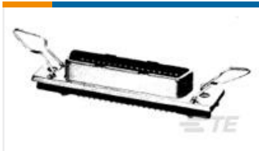
TE 产品编号5406874-1 ASSY,RCPT,50POS,SHD,LPF,V/MTG