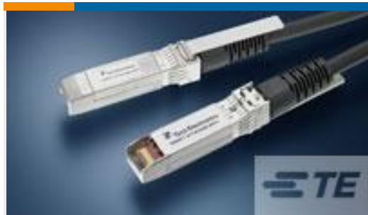
TE 产品编号2127931-1 C/A, SFP+, GENERIC, 0.5M