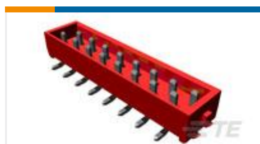
TE 产品编号8-338728-4 MICROM. MOB SMD CON