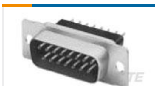
TE 产品编号205714-7 37 PLUG SP/MS STD