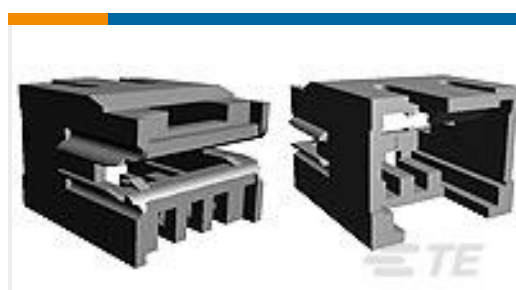
TE 产品编号1-964575-5 PCB RAHMEN 5P