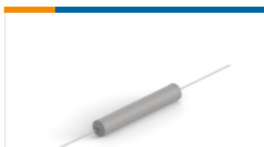
TE 产品编号3-2176416-6 9W STD M/OX 5% 1K5