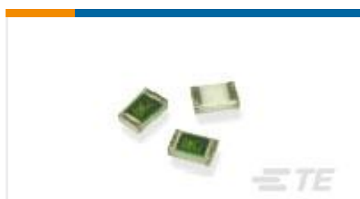
TE 产品编号3-1879134-1 RN 0603 20K5 0.1% 10PPM 1K RL