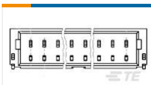
TE 产品编号1-1734709-5 1.0 WTB HDR SR RA 15 POS