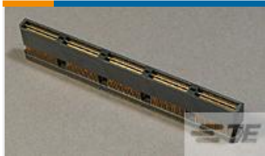
TE 产品编号 3-1658048-5 MSB0.80PL19ASY140DP,GP,F,VCTY