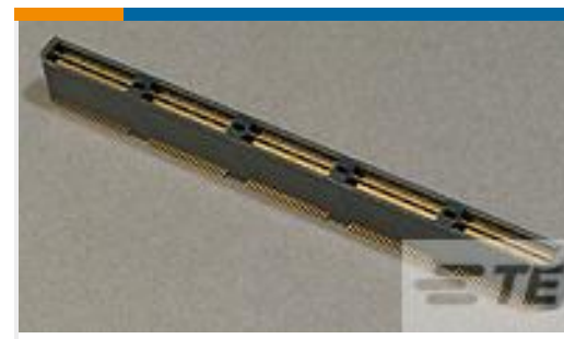
TE 产品编号 3-1658046-5 MSB0.80PL11ASY140DP,GP,F,VCTY