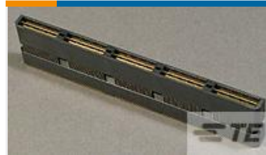
TE 产品编号 3-1658049-5 MSB0.80PL22ASY140DP,GP,F,VCTY