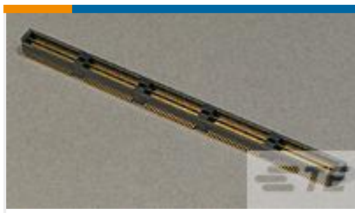
TE 产品编号 3-1658044-5 MSB0.80PL5ASY140DP,GP,F,VCTY