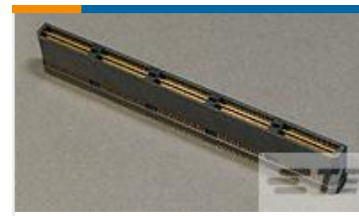
TE 产品编号 3-1658047-5 MSB,0.8MM,PL,16MM,DP,140,TY,F