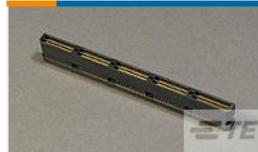
TE 产品编号 3-1658437-5 MSB0.80PL14ASY140DP,GP,F,VCTY