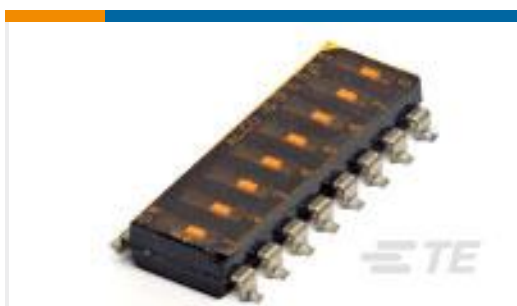
TE 产品编号1-1825006-9 GDS10S04=DIP SW,SLIDE,SMT