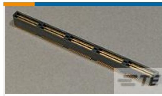
TE 产品编号 3-1658045-5 MSB0.80PL8ASY140DP,GP,F,VCTY