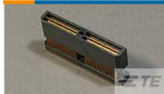
TE 产品编号 3-1658048-2 MSB0.80PL19ASY56DP,GP,F,VCTY