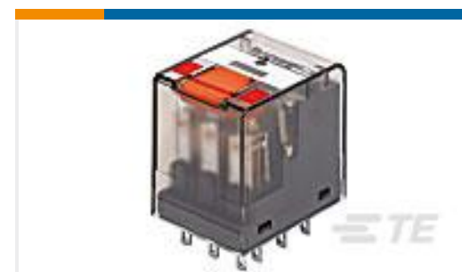
TE 产品编号 3-1415020-1 PT570N20