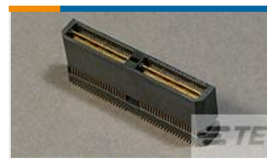
TE 产品编号 3-1658047-2 MSB0.80PL16ASY56DP,GP,F,VCTY