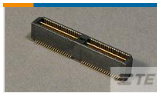
TE 产品编号 3-1658045-2 MSB0.80PL8ASY56DP,GP,F,VCTY