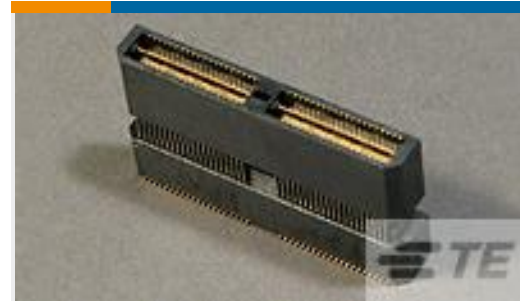
TE 产品编号 3-1658049-2 MSB0.80PL22ASY56DP,GP,F,VCTY