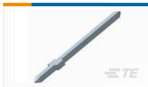
TE 产品编号 1-928836-2 MOD2 PIN WITH A-PIN L/P