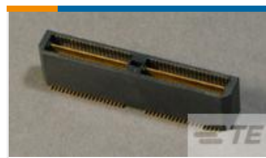
TE 产品编号 3-1658046-2 MSB0.80PL11ASY56DP,GP,F,VCTY