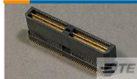
TE 产品编号 3-1658437-2 MSB0.80PL14ASY56DP,GP,F,VCTY