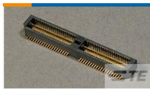
TE 产品编号 3-1658044-2 MSB0.80PL5ASY56DP,GP,F,VCTY