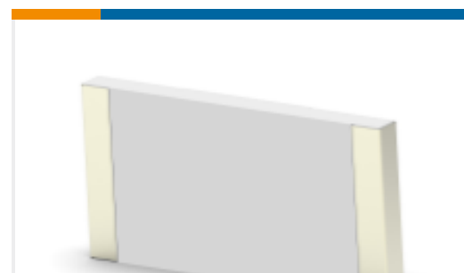
TE 产品编号 7-2176246-6 CRGS2512 5% 1M8