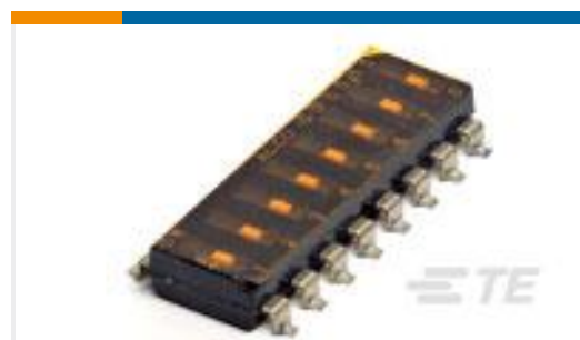
TE 产品编号 1-1825006-9 GDS10S04=DIP SW,SLIDE,SMT