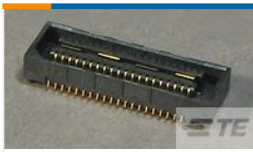
TE 产品编号 3-1658012-1 MSB0.80RC-ASY28DP,-,10,VCTY