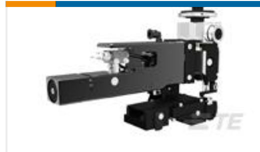
TE 产品编号2151559-2 OCEAN_2.0_APPLICATOR-S-062F155O-RSA