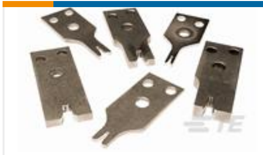
TE 产品编号2-1333281-7 CRIMPER, WIRE, F PREMIUM (.042")