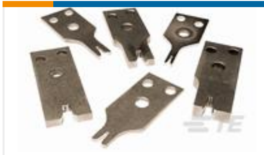
TE 产品编号4-1633713-1 CRIMPER, WIRE PREMIUM