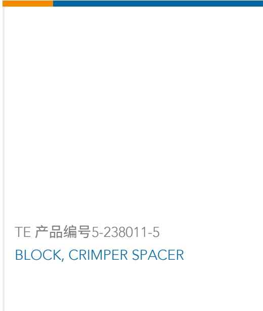
TE 产品编号5-238011-5 BLOCK, CRIMPER SPACER