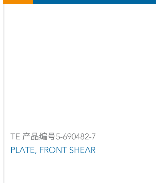
TE 产品编号5-690482-7 PLATE, FRONT SHEAR