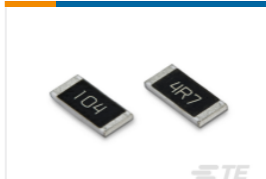
TE 产品编号2-2176455-5 CPF 0402 7R5 0.1% 25ppm 1K RL