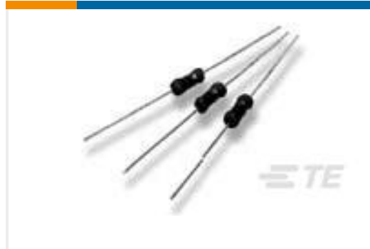
TE 产品编号1-1625893-3 5W SM M/OX 2% 22R