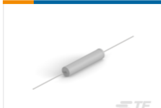
TE 产品编号9-2176415-0 8W STD M/OX 5% 150K