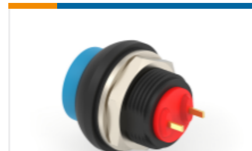
TE 产品编号2-2329328-0 PB OFF/ON HC BLU M4 TERM. IP68