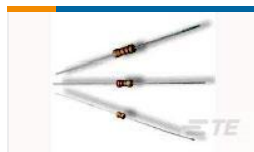
TE 产品编号 2-1623929-2 CFR200 5% 22K