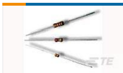
TE 产品编号 1623925-2 CFR100 5% 100R