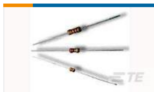
TE 产品编号 1623930-3 CFR25 5% 10K