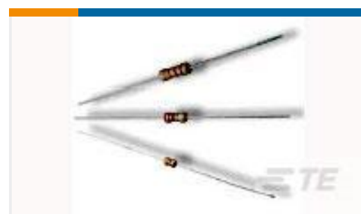
TE 产品编号 1623927-8 CFR16 5% 120R