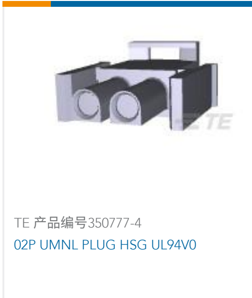
TE 产品编号350777-4 02P UMNL PLUG HSG UL94V0