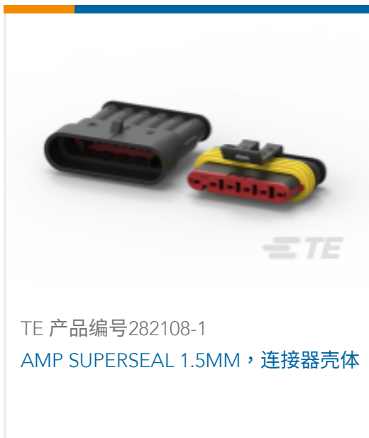
TE 产品编号282108-1 AMP SUPERSEAL 1.5MM, 连接器壳体