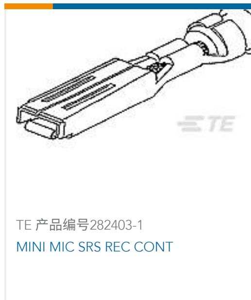
TE 产品编号282403-1 MINI MIC SRS REC CONT