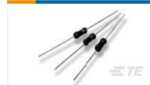
TE 产品编号5-1625892-2 3W SM M/OX 5% 470R