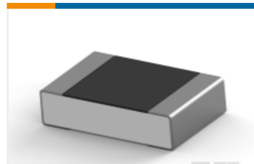
TE 产品编号9-2176380-1 RQ 0805 10K 0.1% 10PPM 5K RL