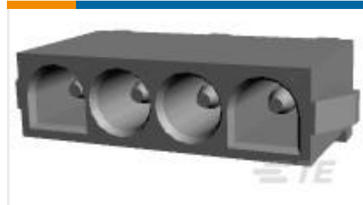
TE 产品编号350430-1 04P UMNL PIN HDR ASSY NATL