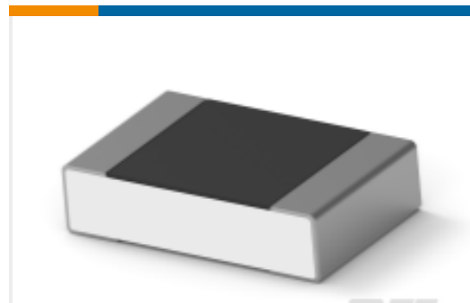
TE 产品编号8-2176381-8 RQ 0805 100K 0.1% 10PPM 5K RL