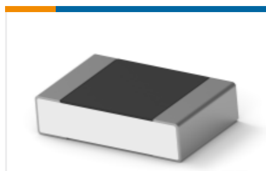
TE 产品编号4-2176381-2 RQ 0805 33K2 0.1% 10PPM 5K RL