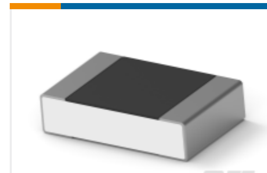
TE 产品编号2-2176381-1 RQ 0805 20K 0.1% 10PPM 5K RL