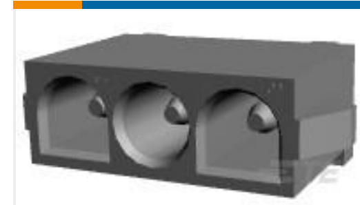
TE 产品编号350429-1 03P UMNL PIN HDR ASSY NATL