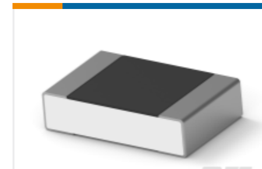
TE 产品编号3-2176381-0 RQ 0805 24K9 0.1% 10PPM 5K RL