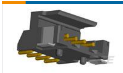
TE 产品编号292173-4 CT BOX HDR H SMT 4P O/TAPE BLA