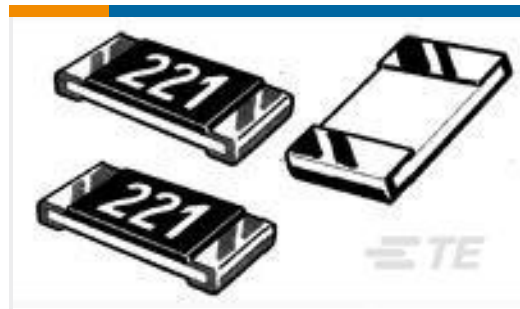
TE 产品编号2176230-7 3522 2R7 5% 3W