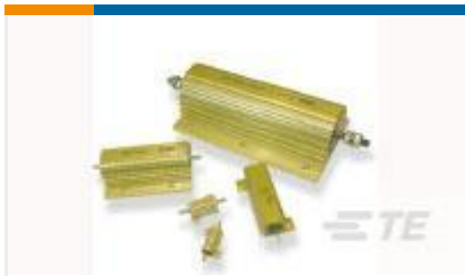
TE 产品编号1625999-1 HSC100 100R 5%