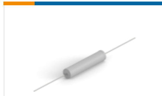
TE 产品编号7-2176415-3 8W STD M/OX 5% 30K