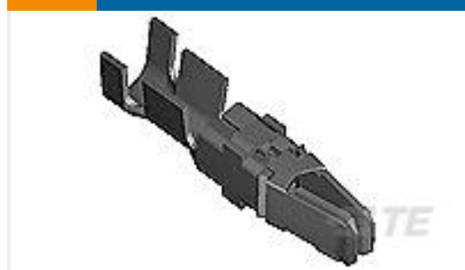
TE 产品编号66741-6 TYPE XII FEMALE CONT (L.P.)