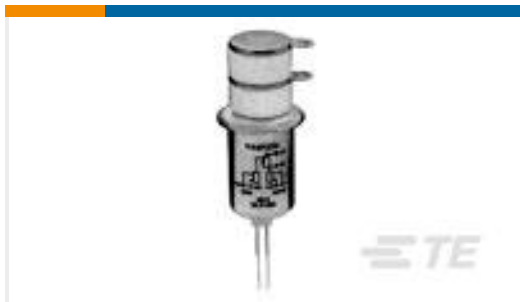
TE 产品编号5-1618240-0 K44P334=RELAY, VACUUM SPST LAT