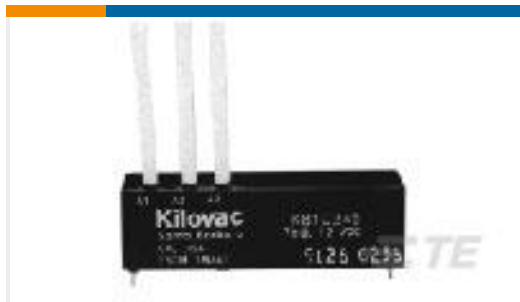
TE 产品编号5-1618241-7 K81C245=RELAY, VACUUM, SPDT