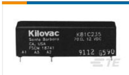
TE 产品编号6-1618241-0 K81C335=RELAY, VACUUM, SPDT