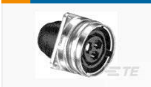
TE 产品编号208485-1 CMC RECPT ASSEMBLY SIZE 28