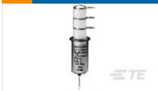
TE 产品编号5-1618239-0 K41C334=RELAY, VACUUM, SPDT