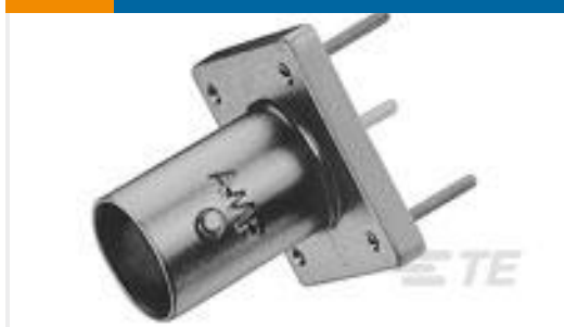
TE 产品编号5227699-2 BNC PCB VERTICAL