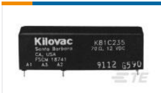
TE 产品编号5-1618241-6 K81C235=RELAY, VACUUM, SPDT