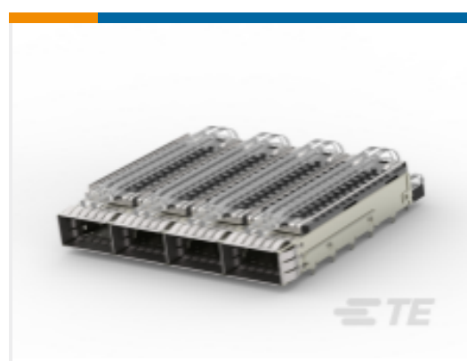
TE 产品编号2-2170747-1 CAGE ASSY, 1X4, QSPF28, SPRING, HS, LP