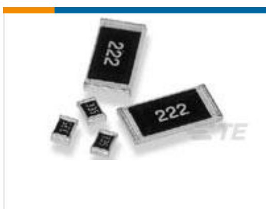
TE 产品编号1879531-6 CRGV2010 5% 82K 3000V