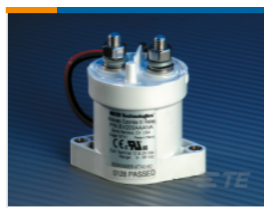
TE 产品编号1-1618002-6 EV200H2ANA=RELAY, SPST-NO W /AUX