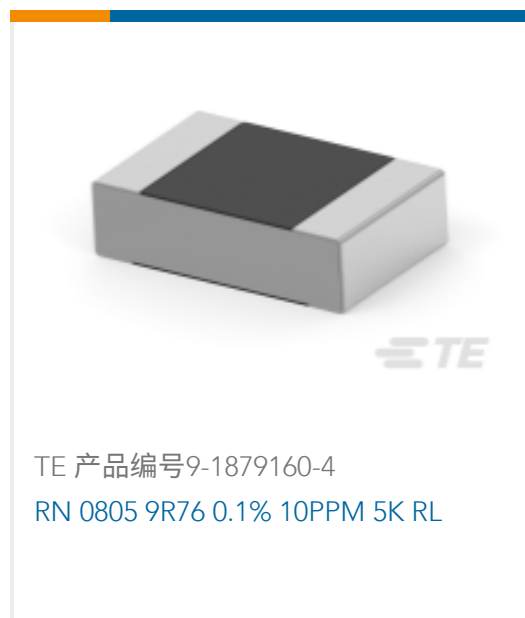
TE 产品编号9-1879160-4 RN 0805 9R76 0.1% 10PPM 5K RL