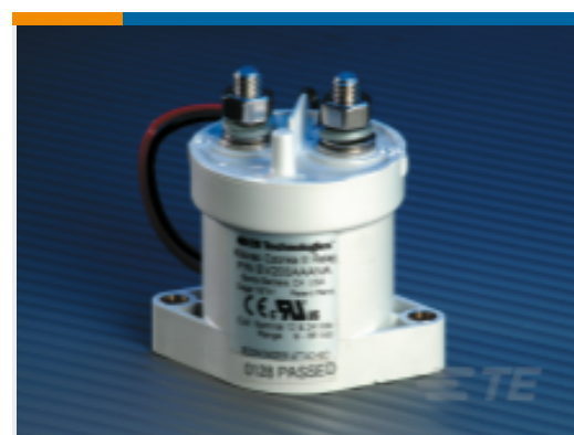
TE 产品编号1-1618002-6 EV200H2ANA=RELAY, SPST-NO W /AUX