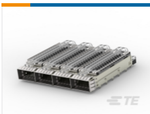
TE 产品编号2-2170747-1 CAGE ASSY, 1X4, QSP28, SPRING, HS, LP