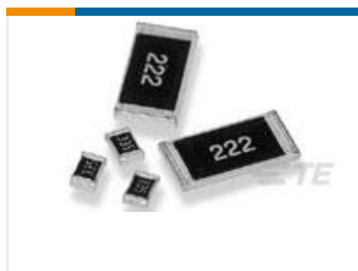
TE 产品编号1879531-6 CRGV2010 5% 82K 3000V