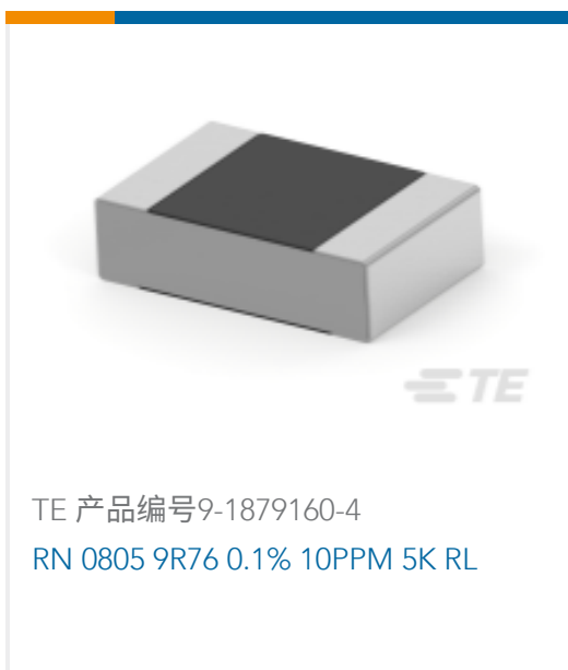
TE 产品编号9-1879160-4 RN 0805 9R76 0.1% 10PPM 5K RL