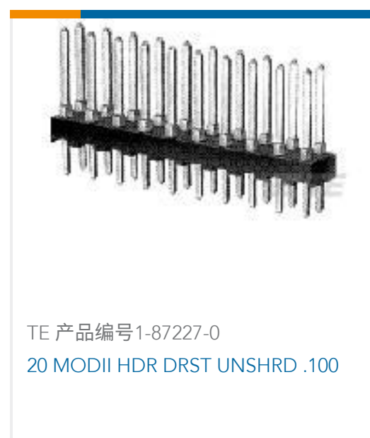
TE 产品编号1-87227-0 20 MODII HDR DRST UNSHRD .100