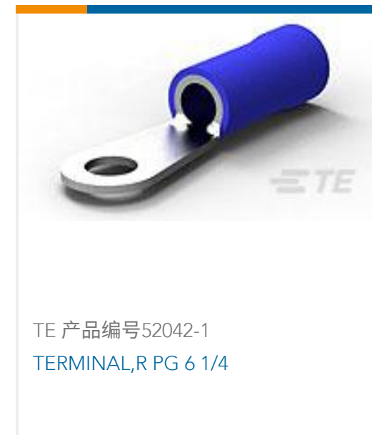
TE 产品编号52042-1 TERMINAL,R PG 6 1/4