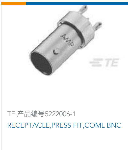
TE 产品编号5222006-1 RECEPTACLE,PRESS FIT,COML BNC