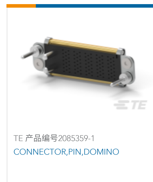
TE 产品编号2085359-1 CONNECTOR,PIN,DOMINO