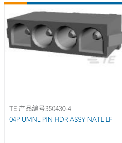
TE 产品编号350430-4 04P UMNL PIN HDR ASSY NATL LF