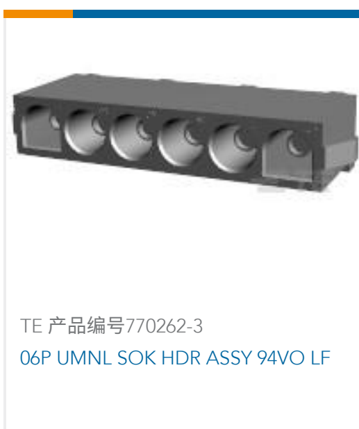
TE 产品编号770262-3 06P UMNL SOK HDR ASSY 94VO LF