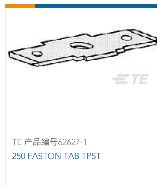
TE 产品编号62627-1 250 FASTON TAB TPST