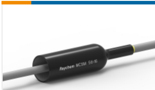
TE 产品编号EE0477-000 WCSM-56/16-1200-S-(B10)