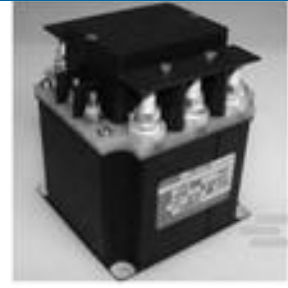
TE 产品编号1616021-6 SA136A=CONTACTOR 3PST N.O. 75