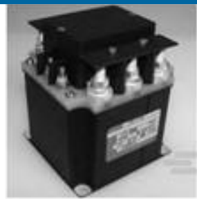
TE 产品编号1616021-6 SA136A=CONTACTOR 3PST N.O. 75