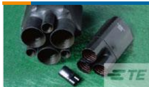
TE 产品编号476449-000 CBR-2-3-A-(B3)