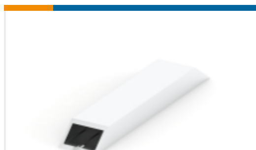
TE 产品编号2176290-5 CJN 150W 18R 5% LEAD