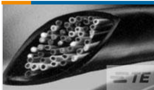
TE 产品编号5550074007 NT-1-0-SP