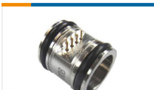
TE 产品编号DP86-050D 50 PSID MV DIFFERENTIAL PRESSURE SENSOR