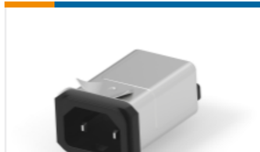
TE 产品编号6-1609157-2 3IHS1=F8459