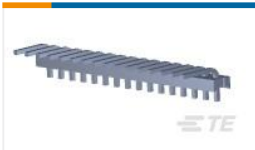
TE 产品编号1-640385-6 16P MTA156 HDR ASSY SQ R/A