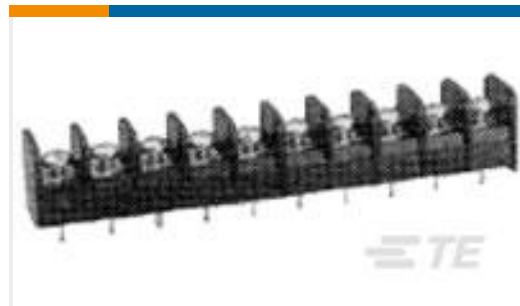
TE 产品编号3-1437416-2 SSB7FP090202="STRIP,SSB 7/16 A