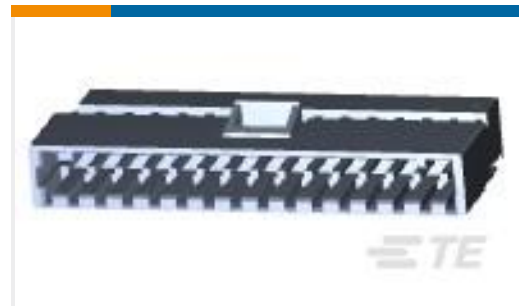
TE 产品编号4-641435-5 15P MTA156 CONN ASSY ORNG