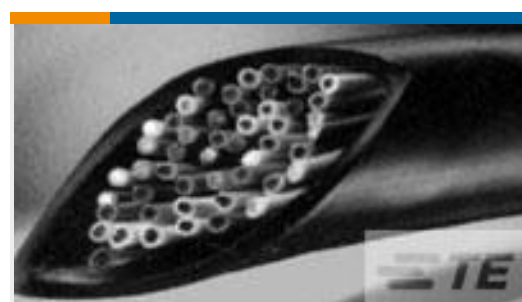
TE 产品编号F41960-000 NT-MIL-1-1/4-0-SP