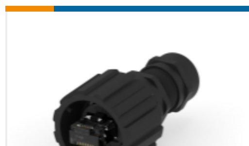
TE 产品编号2362760-2 IDC PLUG, PBT