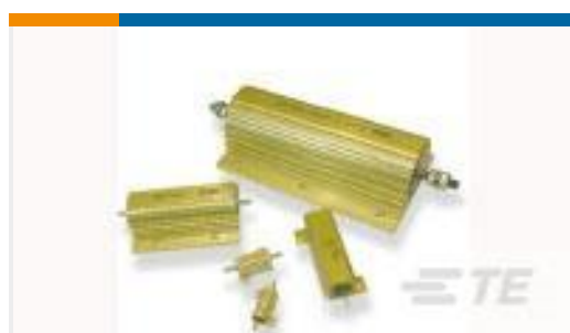
TE 产品编号4-1630186-2 HSA50 13R6 5%