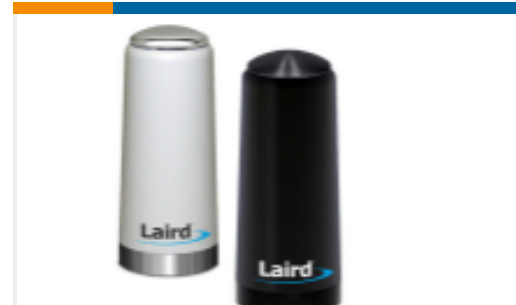
TE 产品编号TRA6927M3NW-001 OMNI,Ph,NMO,698/1710 MHz WHT,3 dBi,100W,