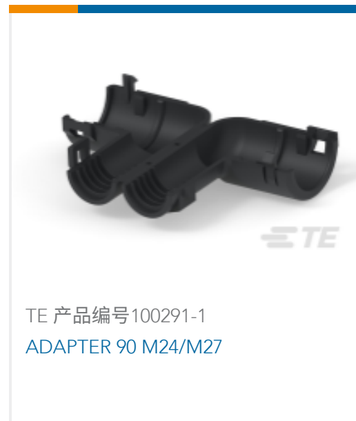
TE 产品编号100291-1 ADAPTER 90 M24/M27