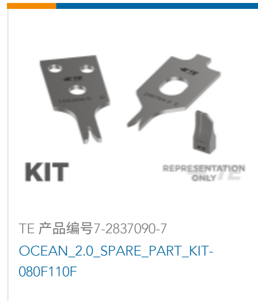
TE 产品编号7-2837090-7 OCEAN_2.0_SPARE_PART_KIT-080F110F