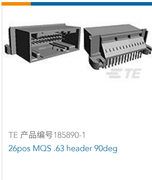
TE 产品编号185890-1 26pos MQS .63 header 90deg