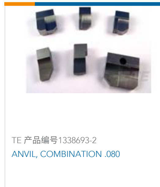
TE 产品编号1338693-2 ANVIL, COMBINATION .080