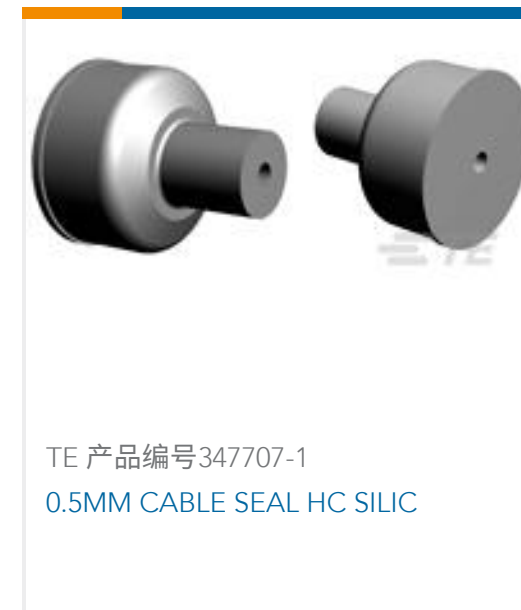
TE 产品编号347707-1 0.5MM CABLE SEAL HC SILIC