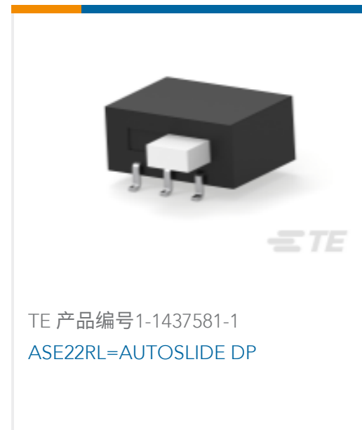
TE 产品编号1-1437581-1 ASE22RL=AUTOSLIDE DP 0.3W