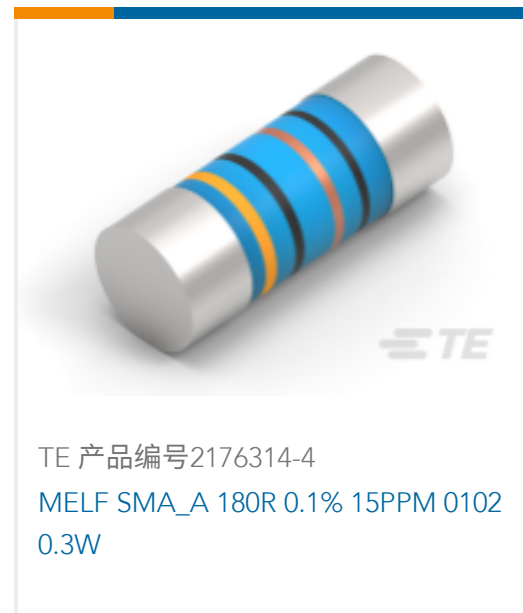
TE 产品编号2176314-4 MELF SMA_A 180R 0.1% 15PPM 0102 0.3W