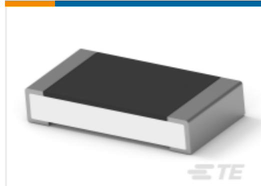
TE 产品编号4-2176391-7 RQ 1206 37K4 0.1% 10PPM 5K RL