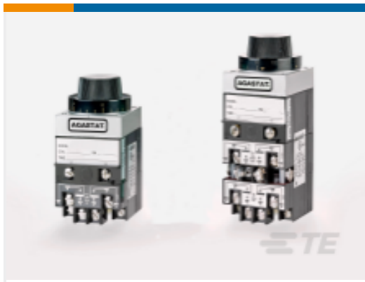
TE 产品编号 1423157-5 7012AC=RLY,STD,ON,2P,120VAC,15