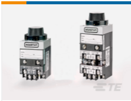
TE 产品编号 2-1423159-6 7012PD=RLY,STD,ON,2P,125VDC,50