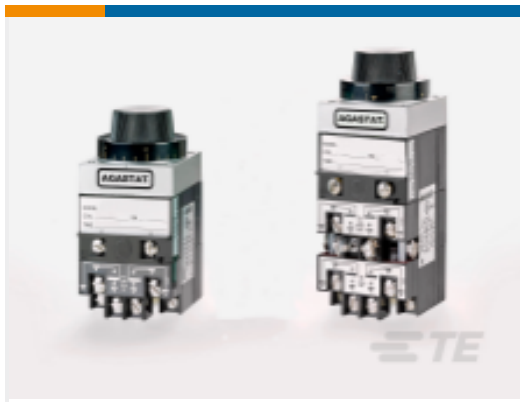
TE 产品编号 1-1423159-9 7012PB=RLY,STD,ON,2P,125VDC, 5