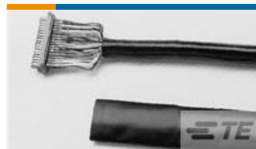
TE 产品编号530219P009 RNF-150-1/4-0-1.25IN