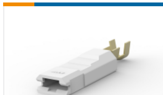
TE 产品编号1969104-1 ULTRA POD：直形，母端组件，无镀层，0.250 英寸