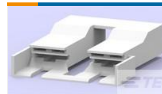
TE 产品编号1-521253-3 PL MKIII & FASTON 250 HSG 2P NYLON GREEN