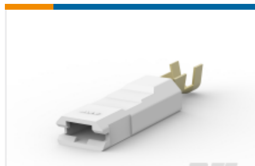
TE 产品编号1969104-1 ULTRA POD：直形，母端组件，无镀层，0.250 英寸