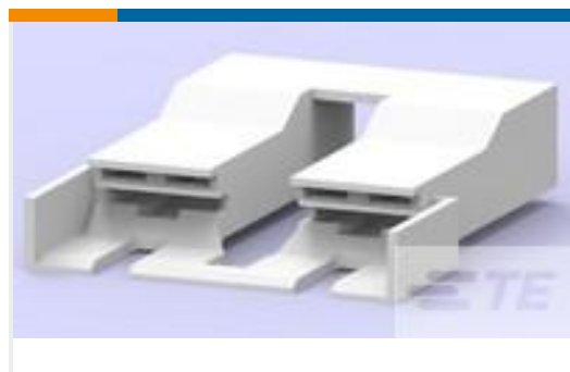
TE 产品编号1-521253-3 PL MKIII & FASTON 250 HSG 2P NYLON GREEN