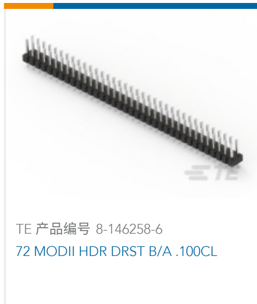
TE 产品编号 8-146258-6 72 MODII HDR DRST B/A .100CL