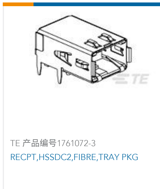
TE 产品编号1761072-3 RECPT,HSSDC2,FIBRE,TRAY PKG