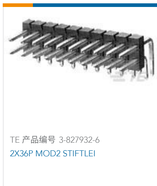
TE 产品编号 3-827932-6 2X36P MOD2 STIFTLEI