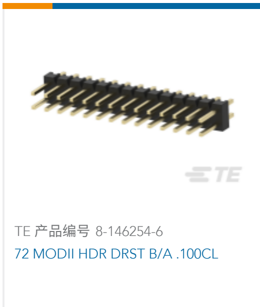
TE 产品编号 8-146254-6 72 MODII HDR DRST B/A .100CL