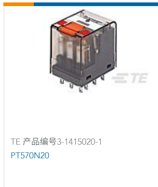
TE 产品编号3-1415020-1 PT570N20