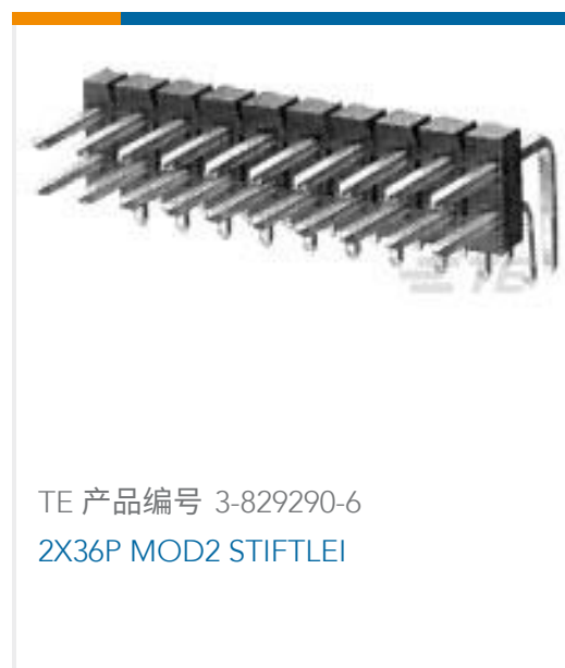
TE 产品编号 3-829290-6 2X36P MOD2 STIFTLEI