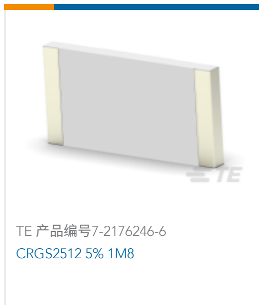
TE 产品编号7-2176246-6 CRGS2512 5% 1M8