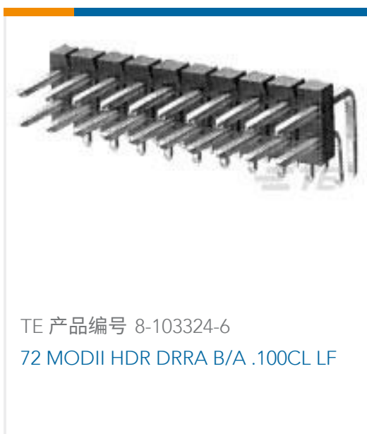
TE 产品编号 8-103324-6 72 MODII HDR DRRA B/A .100CL LF