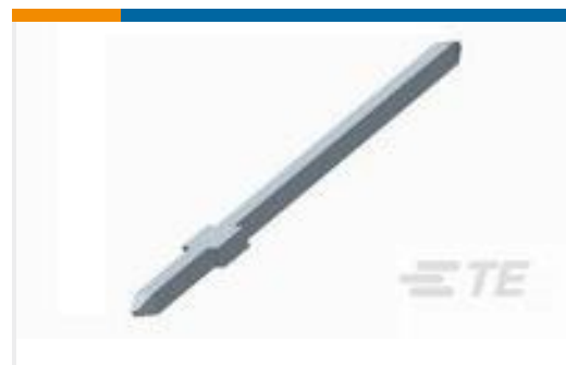
TE 产品编号1-928836-2 MOD2 PIN WITH A-PIN L/P