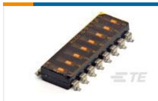
TE 产品编号1-1825006-9 GDS10S04=DIP SW,SLIDE,SMT