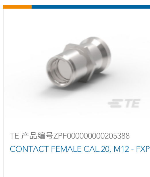
TE 产品编号ZPF000000000205388 CONTACT FEMALE CAL.20, M12 - FXP