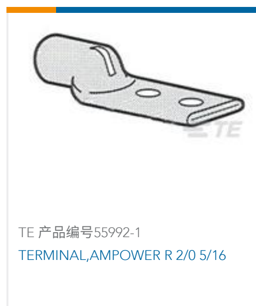
TE 产品编号55992-1 TERMINAL,AMPOWER R 2/0 5/16