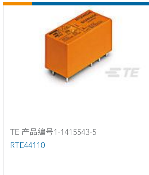
TE 产品编号1-1415543-5 RTE44110