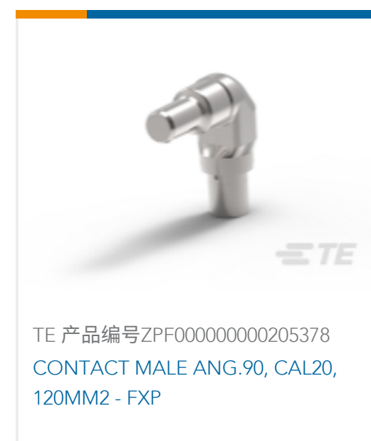
TE 产品编号ZPF000000000205378 CONTACT MALE ANG.90, CAL20, 120MM2 - FXP