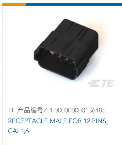
TE 产品编号ZPF000000000136485 RECEPTACLE MALE FOR 12 PINS, CAL1,6