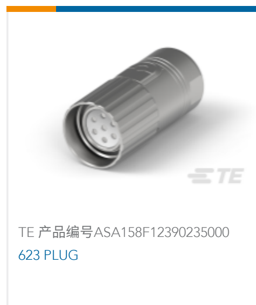
TE 产品编号ASA158F12390235000 623 PLUG