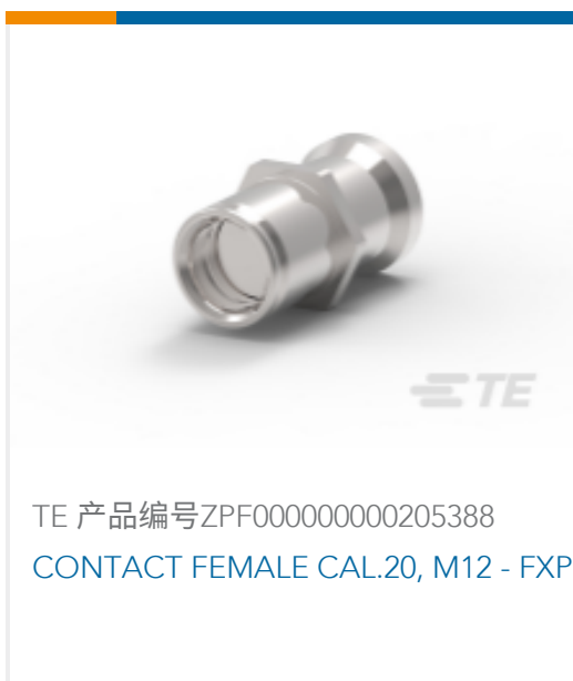
TE 产品编号ZPF000000000205388 CONTACT FEMALE CAL.20, M12 - FXP