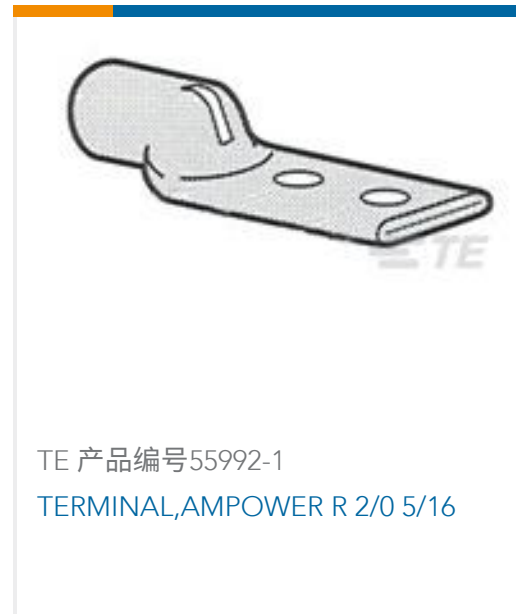
TE 产品编号55992-1 TERMINAL,AMPOWER R 2/0 5/16