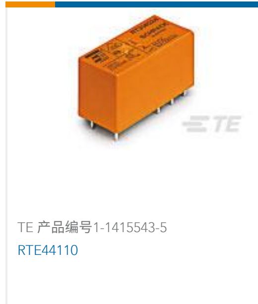
TE 产品编号1-1415543-5 RTE44110