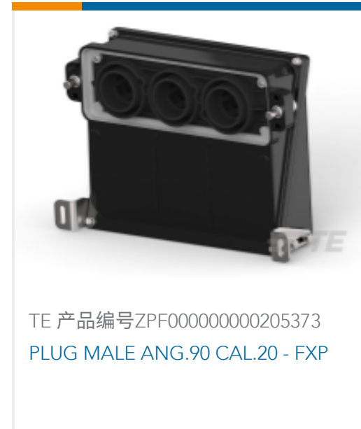
TE 产品编号ZPF000000000205373 PLUG MALE ANG.90 CAL.20 - FXP