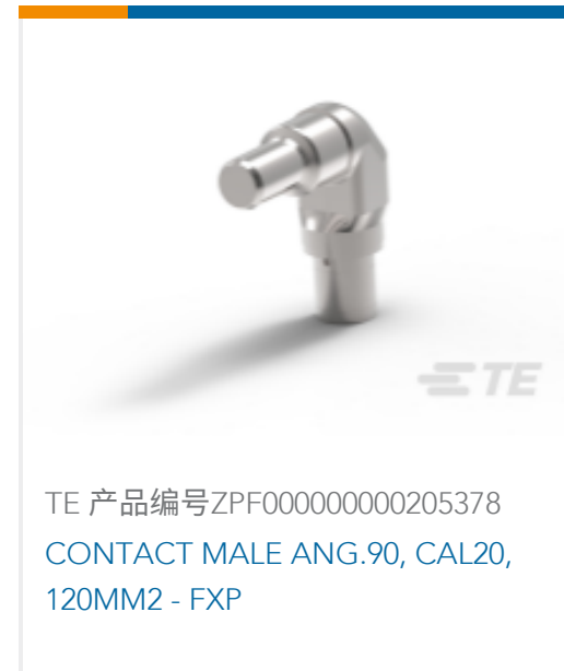
TE 产品编号ZPF000000000205378 CONTACT MALE ANG.90, CAL20, 120MM2 - FXP