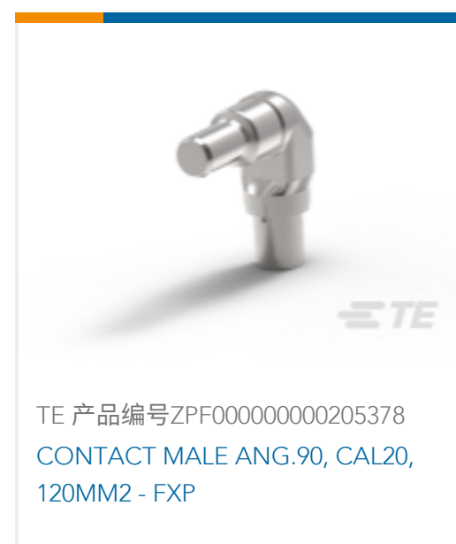
TE 产品编号ZPF000000000205378 CONTACT MALE ANG.90, CAL20, 120MM2 - FXP