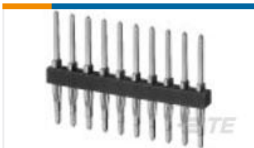
TE 产品编号3-102898-8 05 MODII HDR SRST UNSHRD A/PIN