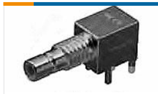
TE 产品编号1084873-1 SCD,1250 2762 09,SMB