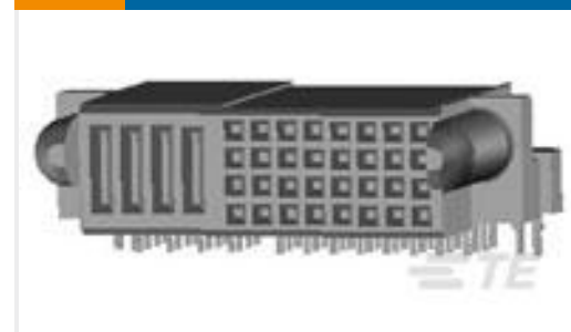
TE 产品编号6450871-1 MBXLE R/A RCPT 32S+4LP