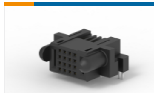
TE 产品编号2-6450880-0 MBXL R/A RCPT 1LP + 16S + 1LP