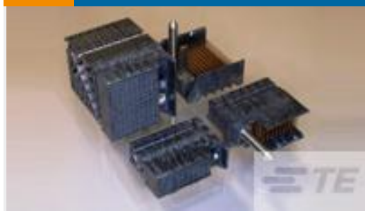
TE 产品编号2057689-1 IMP100S,R,RA3P8C,RG,46