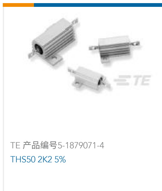
TE 产品编号 5-1879071-4 THS50 2K2 5%