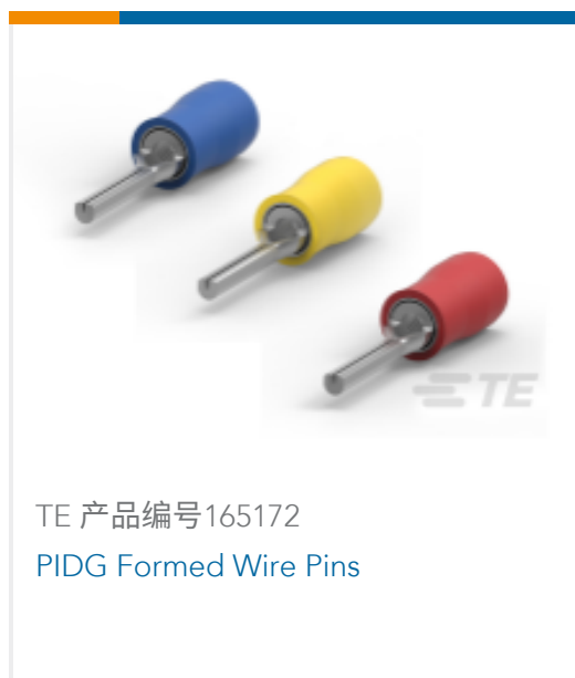
TE 产品编号 165172 PIDG Formed Wire Pins