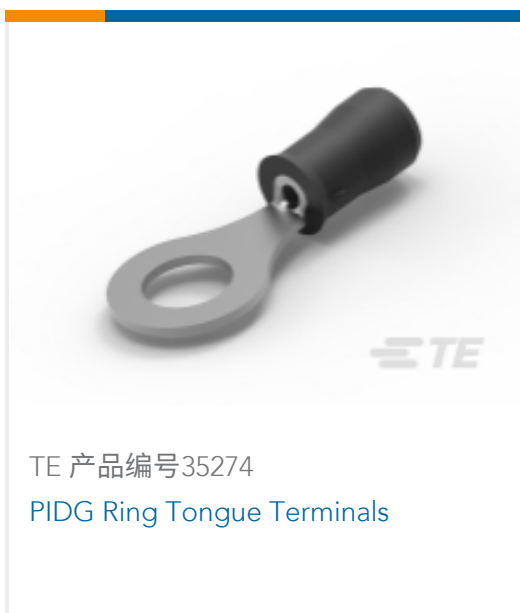
TE 产品编号 35274 PIDG Ring Tongue Terminals