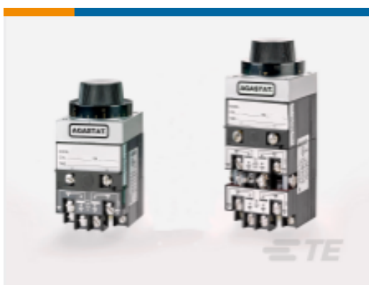
TE 产品编号 1-1423162-8 7022AK=RLY,STD,OFF,2P,120VAC,1