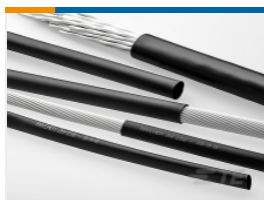
TE 产品编号EH3261-000 ZH150-3/1.5-0-SP