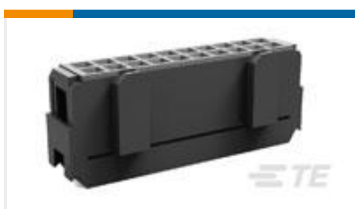
TE 产品编号1658624-9 40 NOVO DUAL 30DP, LEAD FREE