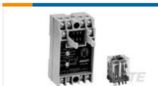
TE 产品编号1423167-4 SSFR90N=48V UNIVERSAL TIMER