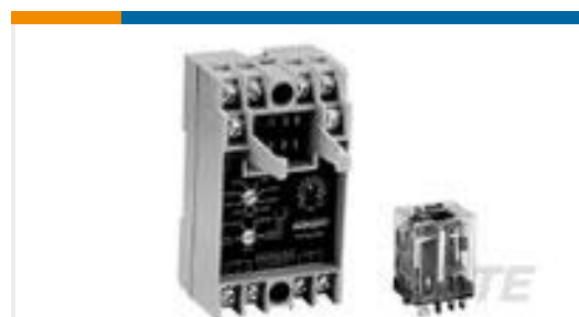
TE 产品编号1423167-3 SSFR90B=UNIV. TIMER 240V