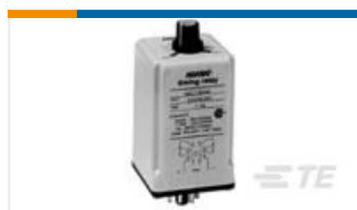
TE 产品编号2-1437471-4 SSC12BPA=240V 50 60HZ .1TO10SE