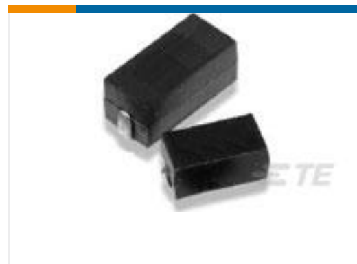
TE 产品编号5-1879011-3 SMF2 33K 5%