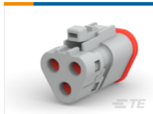
TE 产品编号1-2303816-2 DT06-3S-TN31, PLG, 3P, GRY, N, SNAPCAP