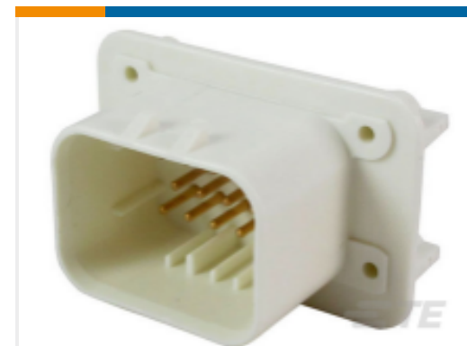
TE 产品编号1-776266-2 14POS, PIN DIA 1.3, HDR ASSY, 90DEG, COD 2