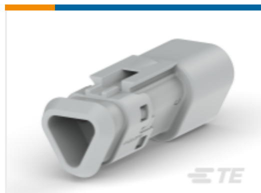
TE 产品编号2-2303813-1 DT04-3P-TE81, REC, 3P, GRY, E, SNAPXCAP