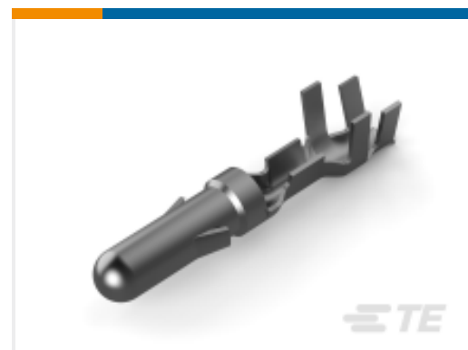
TE 产品编号880684-2 .140 DIA PIN