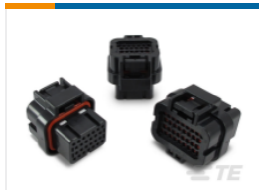
TE 产品编号4-1437290-0 Superseal 连接器护套：1.0 mm