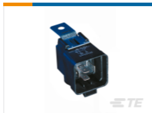
TE 产品编号3-1904131-6 V23134A4064X550-EV-CBOX