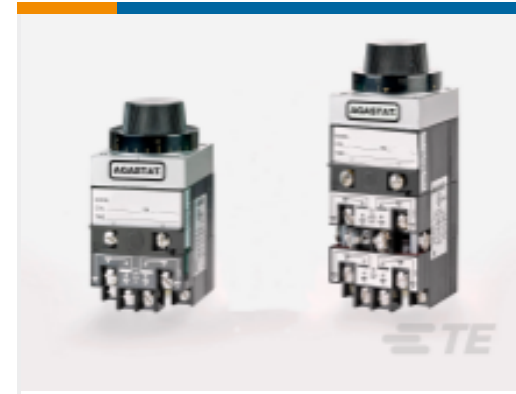
TE 产品编号 1755170-1 7022OCIM=RLY, STD, OFF, 2P, 24V, 15S, I, M