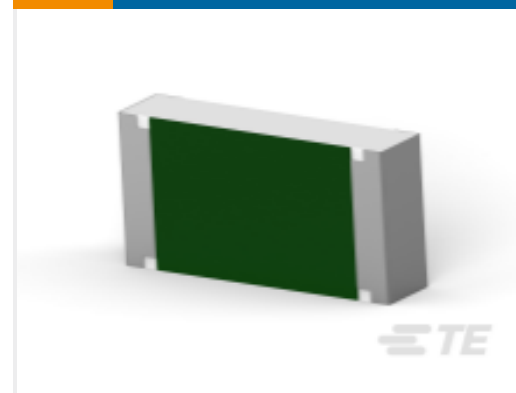
TE 产品编号 1-2176398-4 3502 47K 1%