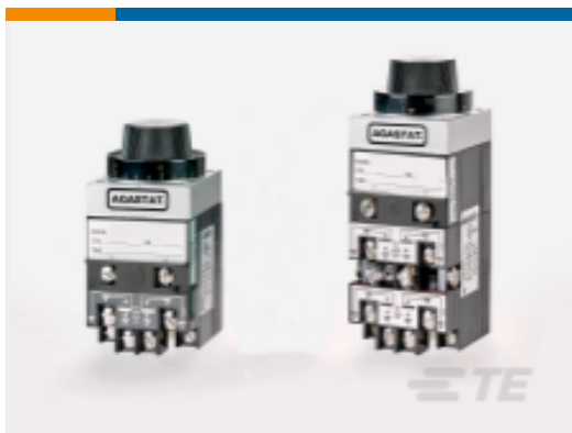
TE 产品编号 7-1472995-0 7012WDS=RLY, STD, ON, 2P, 96V, 50S, S