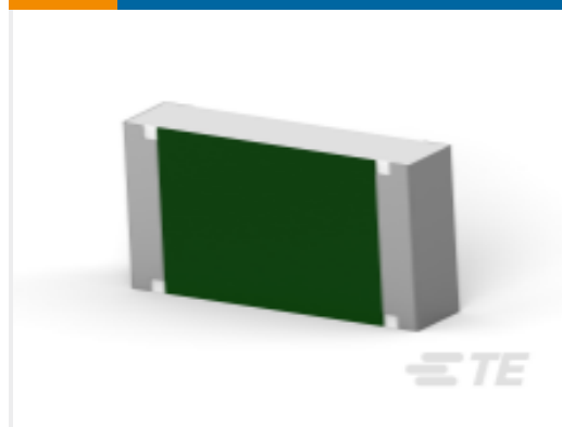
TE 产品编号 2176398-2 3502 15K 1%