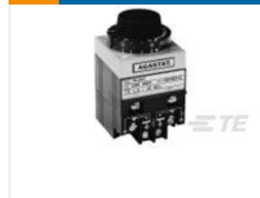
TE 产品编号 6-1755142-4 7022WDIM=RLY, STD, OFF, 2P, 96V, 50S, I, M