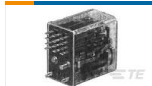
TE 产品编号3-1393766-5 R10-E1Y2-J5.0K=R10