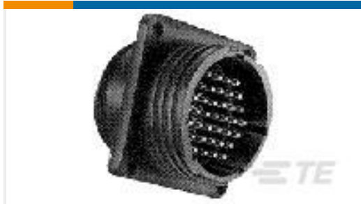
TE 产品编号206036-1 RECEPT,SZ 17-16 CPC