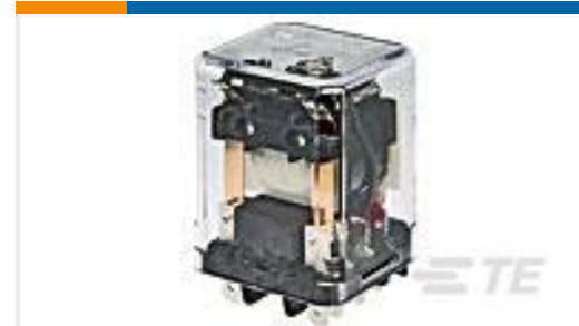
TE 产品编号8-1393113-7 KUEP-11D15-24=KU-