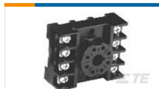
TE 产品编号1437475-3 BDS08SS=SOCKET, 8PIN, STD