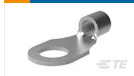
TE 产品编号321600 TERMINAL,SOLIS R 2 3/8