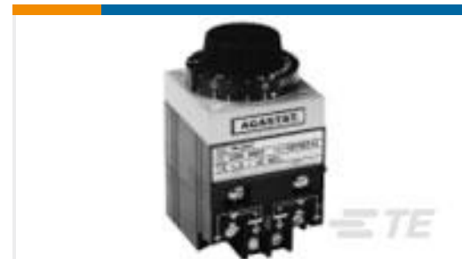
TE 产品编号1-1423162-8 7022AK=RLY,STD,OFF,2P,120VAC,1