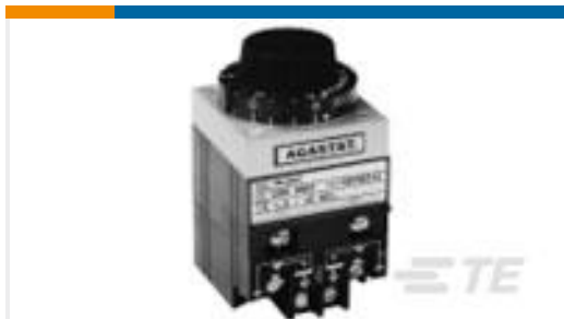
TE 产品编号3-1423159-1 7012PH=RLY,STD,ON,2P,125VDC,30