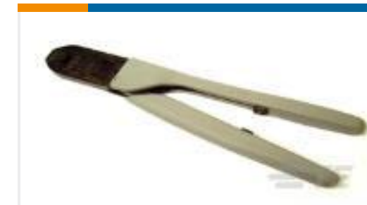
TE 产品编号91550-1 CCII TYPE VI MLTIMATE PIN/SKT 18-14 ASSY