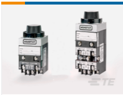
TE 产品编号 2-1423159-6 7012PD=RLY,STD,ON,2P,125VDC,50