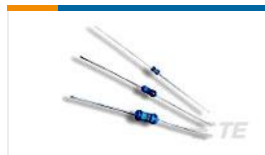
TE 产品编号1622509-1 LR1 1% 511R