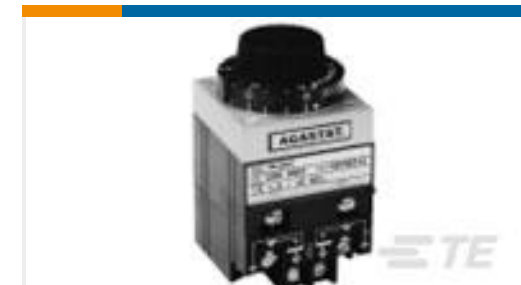
TE 产品编号4-1423159-3 7012PKX=RLY,STD,ON,2P,125VDC,