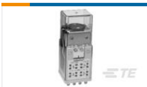
TE 产品编号1423155-6 GPDN=RLY,GEN,PURP,125VDC