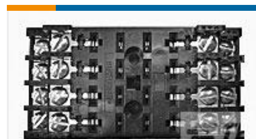
TE 产品编号1-1437436-0 CR0002=RLY SKT - 34121-01