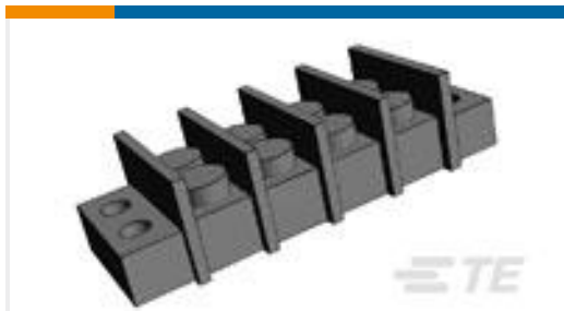
TE 产品编号1546306-4 4P .374" DR BARRIER STRIP