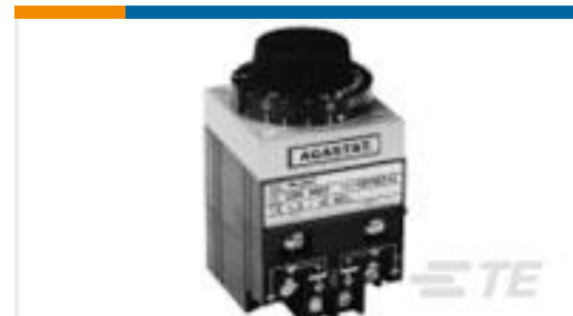
TE 产品编号3-1423159-8 7012PJX=RLY,STD,ON,2P,125VDC,