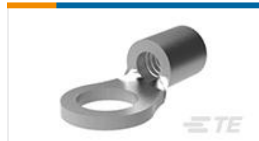
TE 产品编号32860 TERMINAL,BUDG R 26-22 10