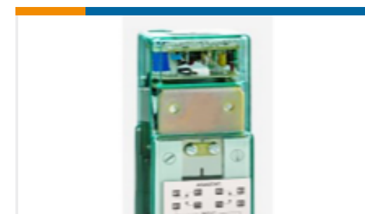
TE 产品编号1423155-7 GPDNC756=RLY,GEN,PURP,125VDC,